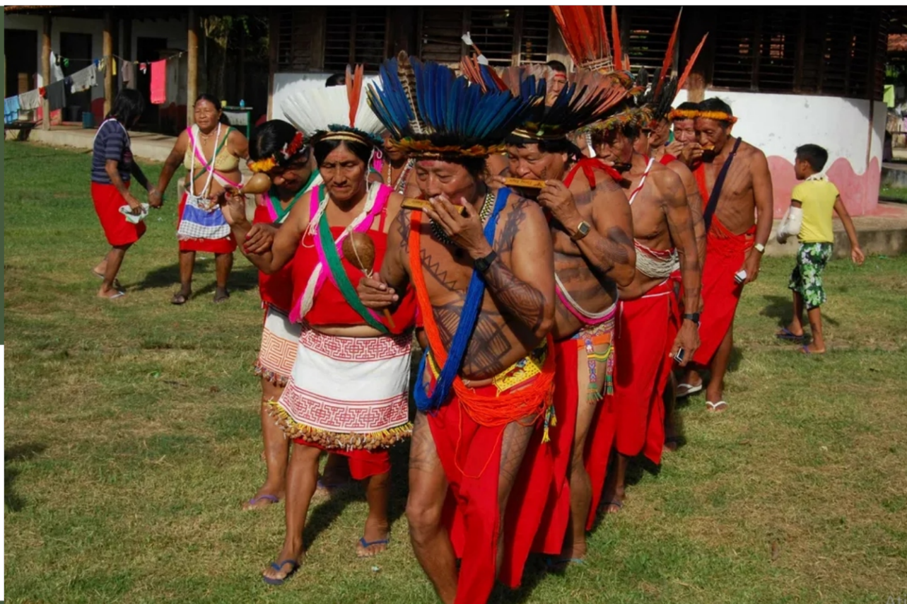
Áreas indígenas no Amapá se concentram em grande parte em Oiapoque, ao Norte do estado