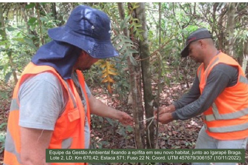
Equipe da Gestão Ambiental fixando a epífita em seu novo habitat, junto ao Igarapé Braga. Lote 2, LD; Km 670,42; Estaca 571; Fuso 22 N; Coord. UTM 457679/306157 (10/11/2022).

Foi realizado o monitoramento mensal das 28 epífitas realocadas pela equipe da Gestão Ambiental, verificando-se o processo adaptativo delas no fragmento florestal, e o desenvolvimento de suas estruturas vegetativas e reprodutivas. Nas vistorias de campo foi realizado o acompanhamento dos 28 indivíduos epifíticos realocados, sendo todos introduzidos junto à Estaca 571 - Lado direito da via, na margem esquerda do Igarapé Braga.