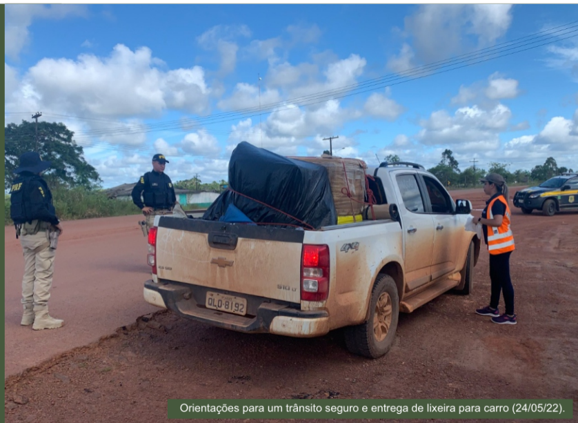
Orientações para um trânsito seguro e entrega de lixeira para carro (24/05/22).

A Polícia Rodoviária Federal-PRF esteve presente para dar apoio nas abordagens de veículos e garantir a segurança dos usuários na rodovia. Nesta ação foram entregues lixeiras para carro, uma forma de conscientizar a respeito do descarte incorreto do lixo nas rodovias e estradas. Foram abordados 200 veículos.