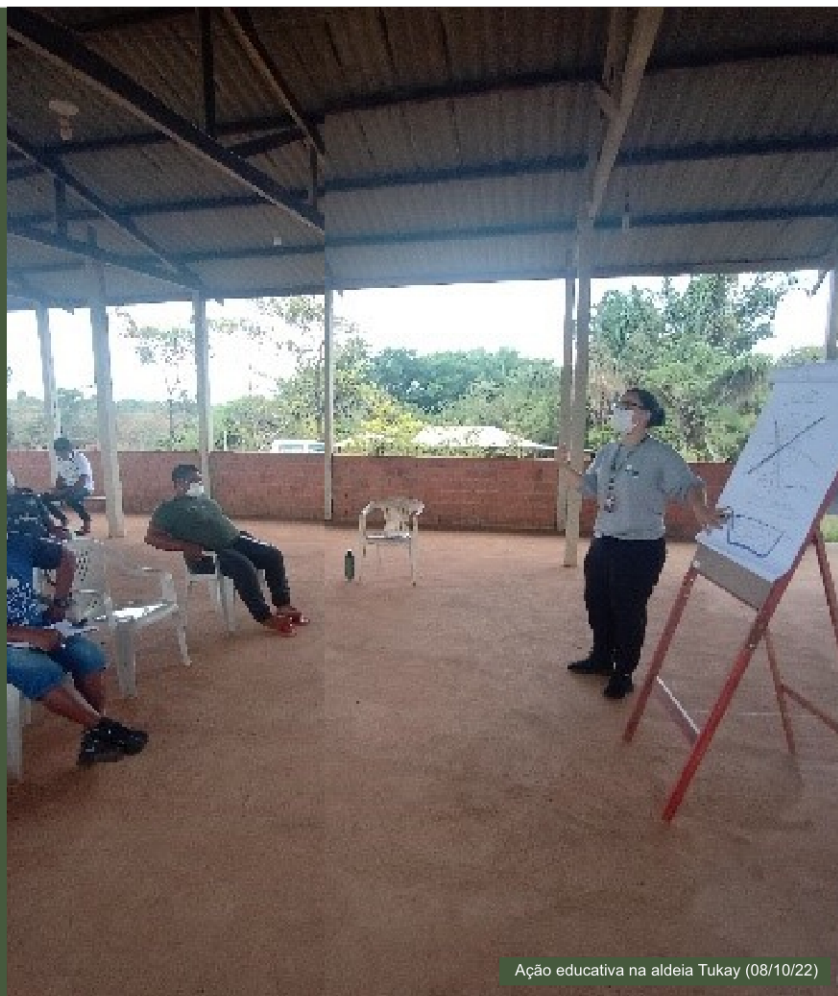
Ação educativa na aldeia Tukay (08/10/22)

As atividades foram pensadas sob uma perspectiva territorial, promovendo a mobilização e participação social. Na oportunidade foram trabalhados assuntos referentes ao manejo de resíduos, atualização de etnomapeamento na escala da aldeia, e elucidações sobre resoluções de problemas relativos ao processo de licenciamento ambiental da BR-156-AP/Norte. Na oportunidade os integrantes da comunidade receberam tonéis para armazenamento de resíduos, construíram mapas de sua aldeia e elaboraram manifestos com as melhorias que desejam.