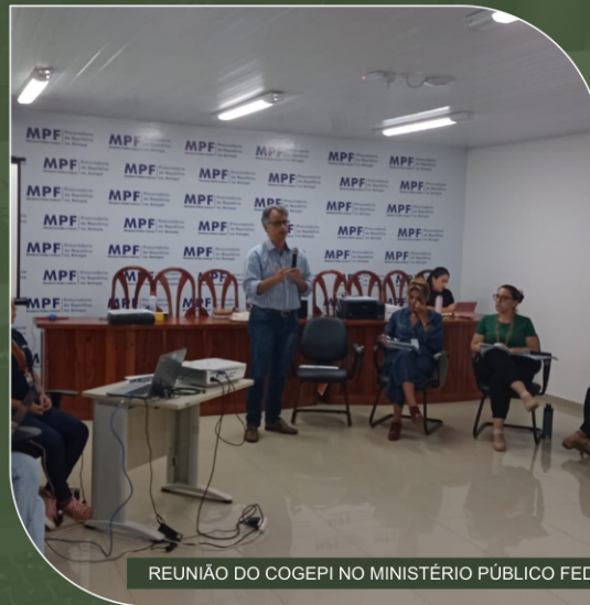
REUNIÃO DO COGEPI NO MINISTÉRIO PÚBLICO FEDERAL