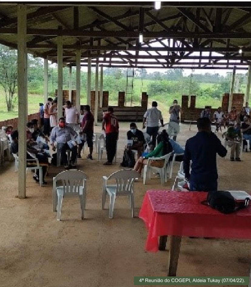
4ª Reunião do COGEPI, Aldeia Tukay (07/04/22).