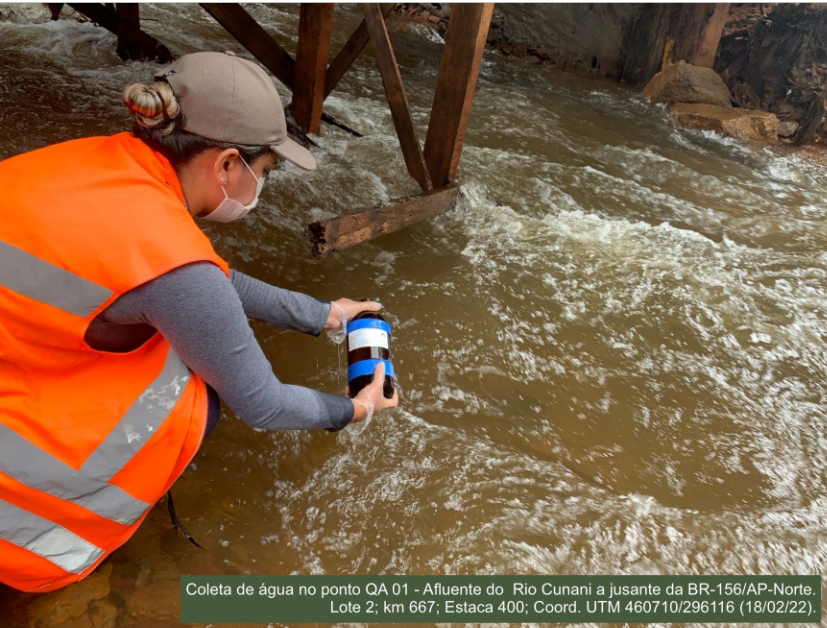
Coleta de água no ponto QA 01 - Afluente do Rio Cunani a jusante da BR-156/AP-Norte. Lote 2; km 667; Estaca 400; Coord. UTM 460710/296116 (18/02/22).