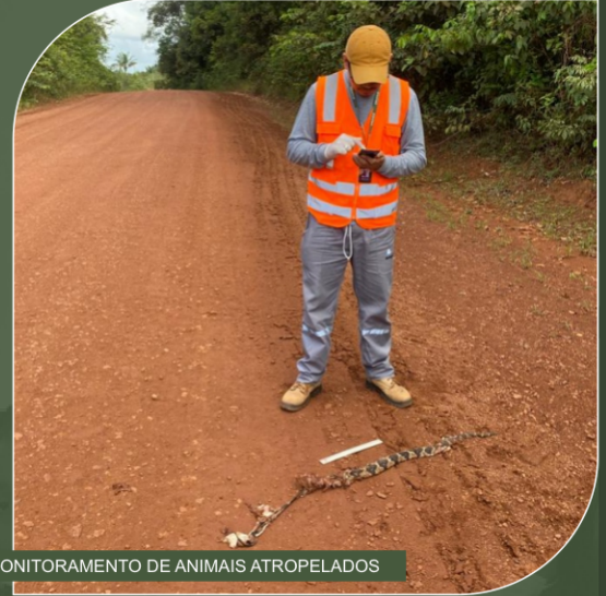
MONITORAMENTO DE ANIMAIS ATROPELADOS