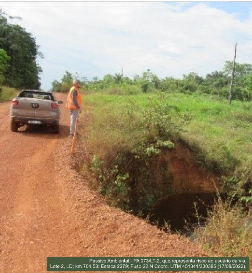
Passivo Ambiental - PA 073/LT-2, que representa risco ao usuário da via. Lote 2, LD; km 704,58; Estaca 2279; Fuso 22 N Coord. UTM 451341/330385 (17/08/2022).