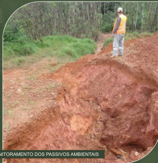
MONITORAMENTO DOS PASSIVOS AMBIENTAIS