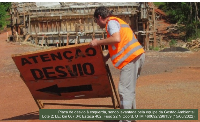
Placa de desvio à esquerda, sendo levantada pela equipe da Gestão Ambiental. Lote 2; LE; km 667,04; Estaca 402; Fuso 22 N Coord. UTM 460692/296159 (15/06/2022).