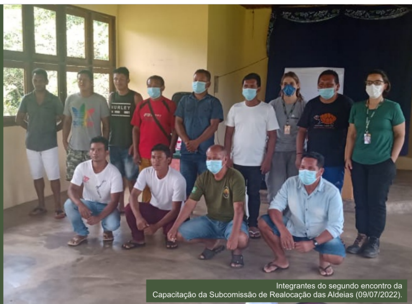
Integrantes do segundo encontro da Capacitação da Subcomissão de Realocação das Aldeias (09/07/2022).

No dia 09 de julho de 2022, realizou-se na sede da Aldeia Anawerá, o 2º encontro de Capacitação da Subcomissão de Realocação das Aldeias, contemplando o Módulo 3 - Etapas do processo e acompanhamento e Módulo 4 - Técnicas de Monitoramento. Na oportunidade foram abordados o histórico do processo em linha do tempo, as etapas de obras e as técnicas de monitoramento adotadas. Também foi entregue o layout geral dos projetos, do arruamento e do paisagismo de cada aldeia em formato A1.