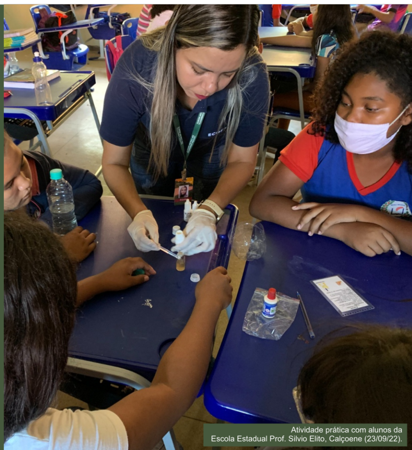
Atividade prática com alunos da Escola Estadual Prof. Sílvio Elito, Calçoene (23/09/22).

Através dessa atividade participaram 39 alunos de duas escolas estaduais no município de Calçoene.