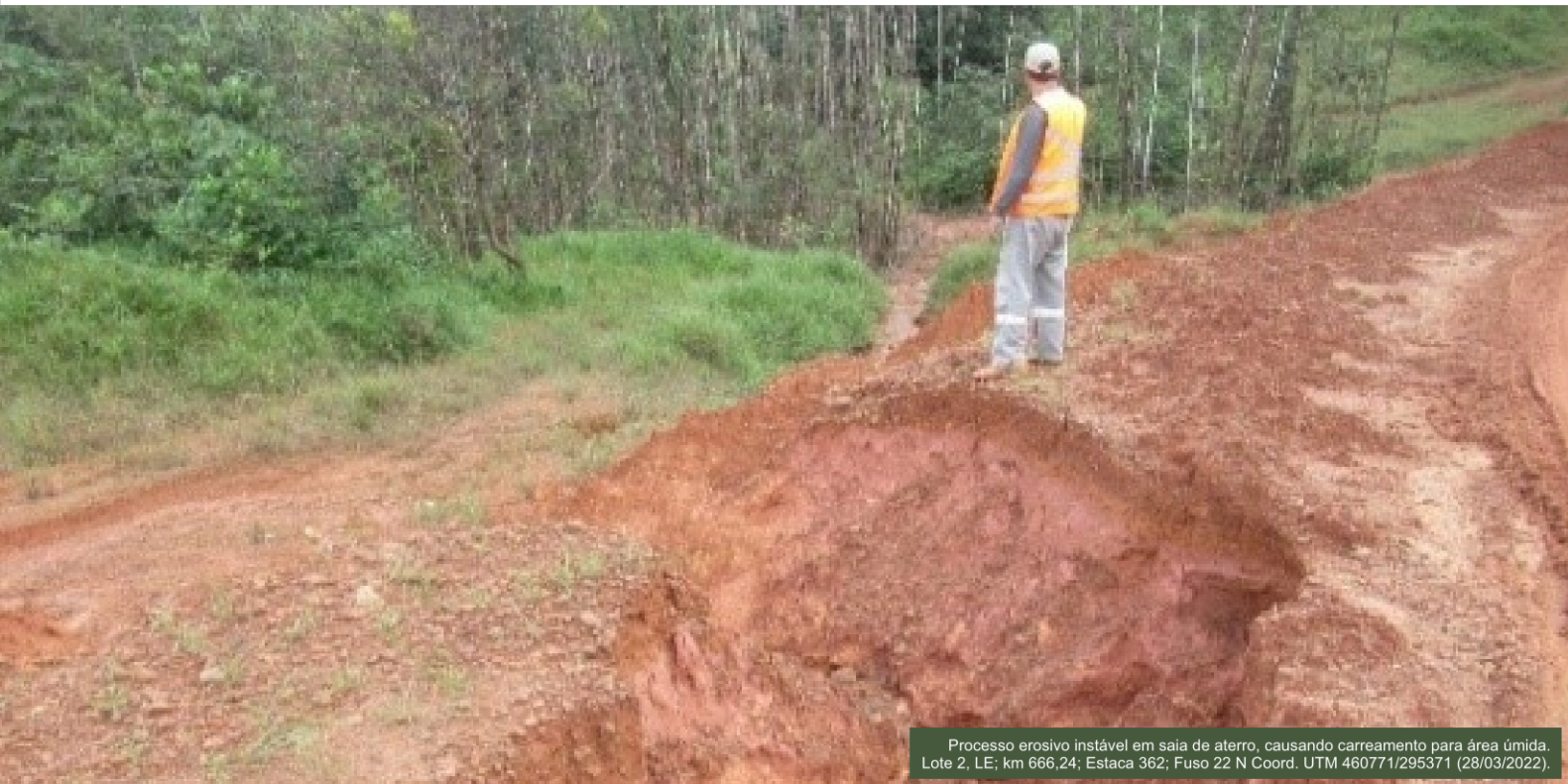
Processo erosivo instável em saída de aterro, causando carreamento para área úmida. Lote 2, LE; km 666,24; Estaca 362; Fuso 22 N Coord. UTM 460771/295371 (28/03/2022).