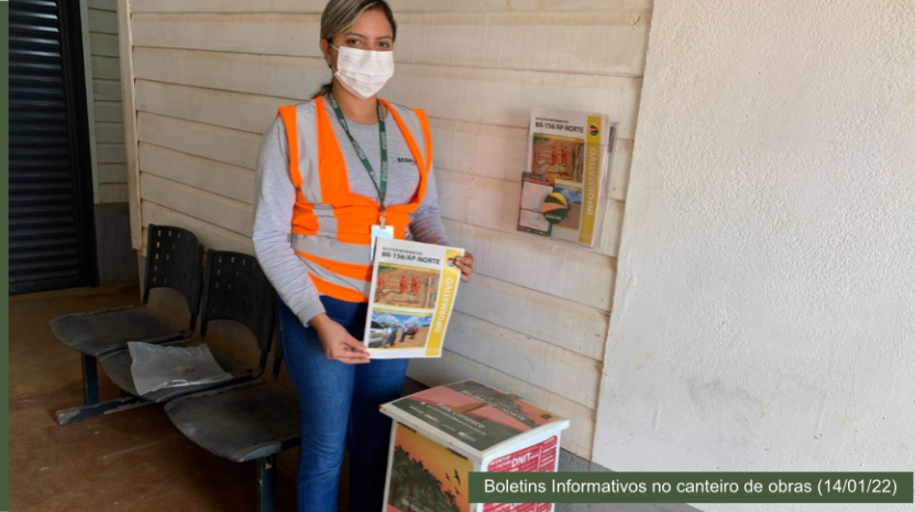
Boletins Informativos no canteiro de obras (14/01/22)

A equipe do Programa de Divulgação e Informação do Empreendimento realizou a campanha de divulgação através do 7º Boletim Informativo. Os boletins foram entregues e afixados na Superintendência Regional do DNIT/AP, canteiro de obras do Consórcio Construtor e Prefeitura de Calçoene.