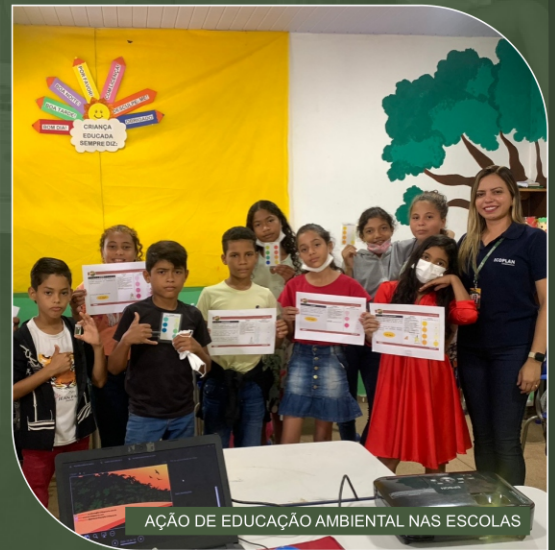
AÇÃO DE EDUCAÇÃO AMBIENTAL NAS ESCOLAS