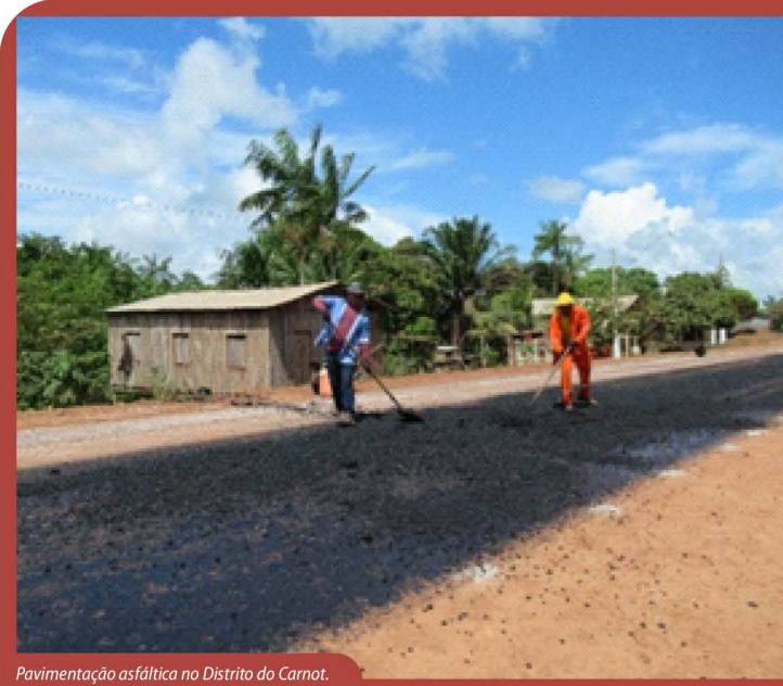
Pavimentação asfáltica no Distrito do Carnot.

Quente (CBUQ) no km 662, em Calçoene, vão garantir melhores condições de trafegabilidade na rodovia federal, segurança e conforto aos usuários.