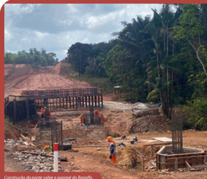
Construção da ponte sobre o Igarapé do Ranolfo.

igarapé Ranolfo teve início em outubro de 2021, com previsão de entrega para o ano de 2022.