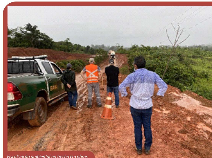
Fiscalização ambiental no trecho em obras.

está sendo executada a obra de implantação e pavimentação da BR-156/AP-Norte.