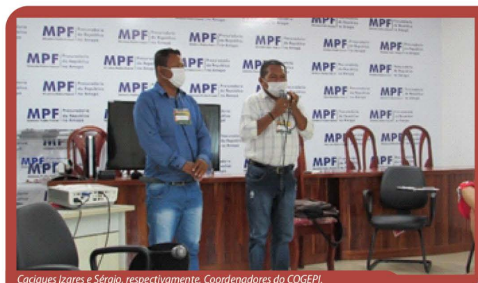
Caciques Izares e Sérgio, respectivamente, Coordenadores do COGEPI.

Na ocasião, também se definiu a necessidade de ampla divulgação de que os povos indígenas da TI Uaçá são a favor da pavimentação da BR 156/AP-Norte e que os atrasos da obra não se devem aos indígenas. Deve ser de conhecimento de todos que, por parte das comunidades indígenas, há disposição e solicitude para que a obra seja realizada, pois elas também serão beneficiadas.