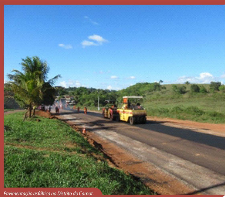
Pavimentação asfáltica no Distrito do Carnot.