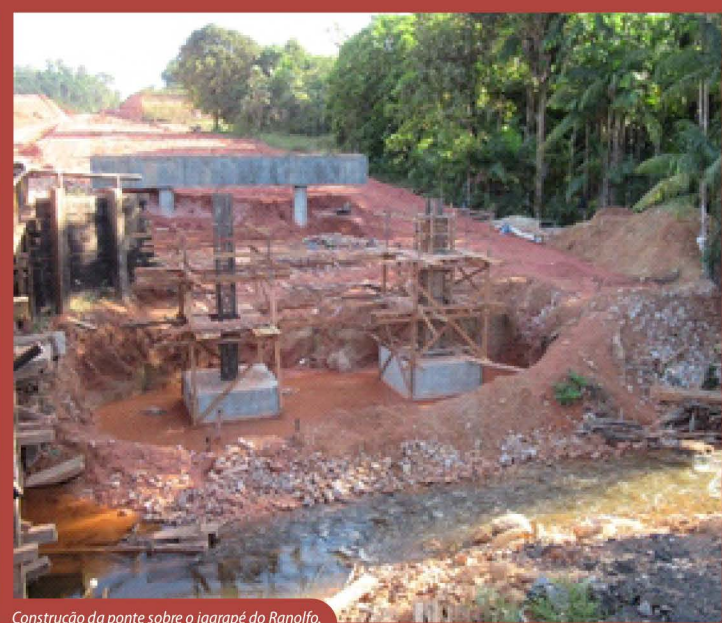
Construção da ponte sobre o Igarapé do Ranolfo.